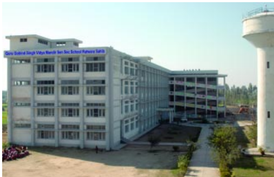
ਗੁਰੂ ਗੋਬਿੰਦ ਸਿੰਘ ਵਿਦਿਆ ਮੰਦਰ ਸੀਨੀਅਰ ਸੈਕੰਡਰੀ ਸਕੂਲ ਰਤਵਾੜਾ ਸਾਹਿਬ