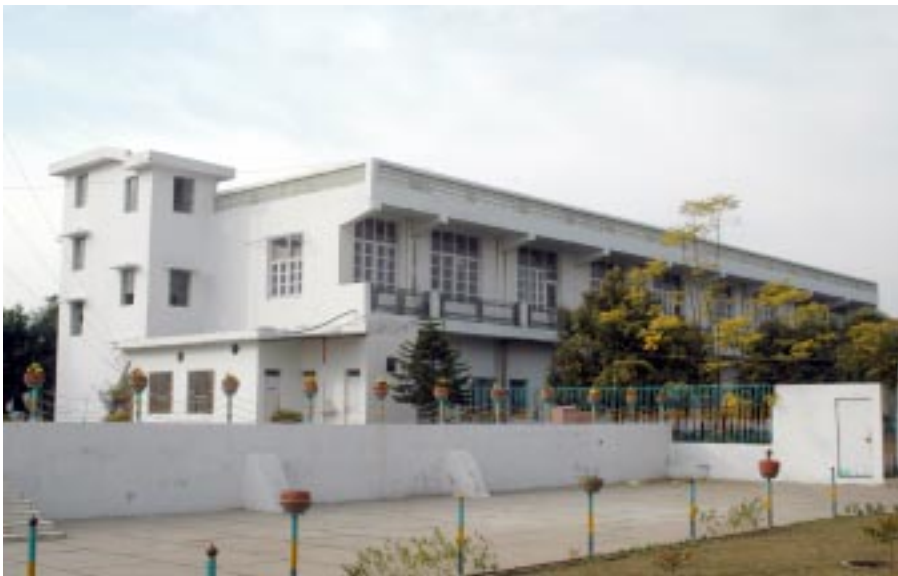
ਸੰਤ ਵਰਿਆਮ ਸਿੰਘ ਮੈਮੋਰੀਅਲ ਪਬਲਿਕ ਹਾਈ ਸਕੂਲ ਰਤਵਾੜਾ ਸਾਹਿਬ

1. ਘੱਟ ਫੀਸ ਲੈ ਕੇ ਸਿਖਿਆ ਦੇ ਪੱਧਰ ਨੂੰ ਉੱਚਾ ਚੁਕਣ ਦੇ ਯਤਨ।